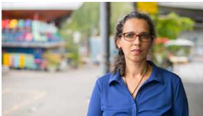
Nadia Diraä Maroc/Belgique

AskPolelo, le projet d'entreprise d'Ashford, permettra d'offrir un service d'assistance en ligne aux jeunes agriculteurs d'Afrique du Sud pour les intéresser à l'agriculture durable. Par le biais d'une application et d'un site web, les agriculteurs pourront par exemple obtenir des informations sur les prix et les achats, recevoir des dons, vendre des légumes et des semences ou encore louer leurs terres arables pour la recherche agricole.