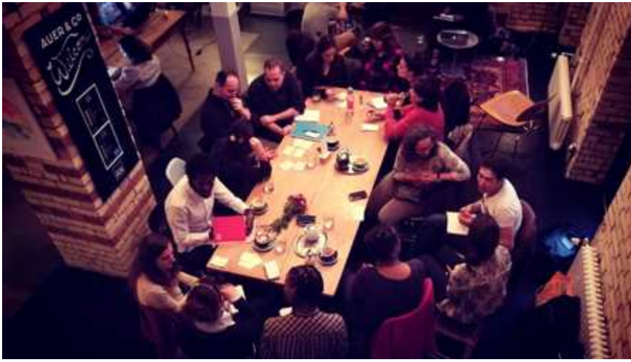
Participant-e-s au Language Café au Café Auer à Zurich