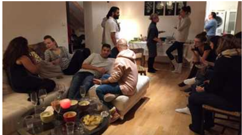
Événement Living Room chez une hôtesse iranienne à Zurich

Au-delà de la SINGA Factory, nous organisons le SINGA Language Café, qui a lieu chaque lundi soir dans un café à Zurich. Le Language Café est ouvert aussi bien aux désireux et aux désireuses d'apprendre qu'aux germanophones et constitue une excellente occasion de rencontrer de nouvelles personnes dans une atmosphère détendue et de parler allemand en petits groupes.